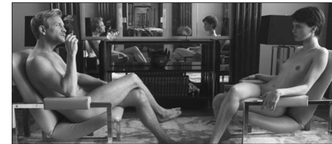
photo de Jérémie Renier face à Marine Vacth, entièrement nus, dans une attitude de dialogue reflété par un miroir laisse une impression étrange : il y a quelque chose de très cérébral dans cette image et l'on devine que l'affaire ne va pas être l'histoire d'une relation ordinaire... "Quand je suis avec toi, je pense à lui, quand je suis avec lui, je pense à toi" murmure Chloé... Paul est psy. Chloé, jeune et jolie

L'Amant double est le dix-septième film de François Ozon, il y retrouve la fascinante Marine Vacth révélée il y a quatre ans dans son Jeune et jolie . Retrouvailles aussi avec le toujours excellent Jérémie Renier, présent déjà dans Les amants criminels et Potiche . Et retrouvailles avec la compétition cannoise ! Moins d'un an après le classique et historique Frantz , qui rencontra un joli succès, l'infatigable François Ozon prend un virage à 180 degrés avec un film résolument contemporain que les premières images laissent entrevoir torride, érotique en diable. La